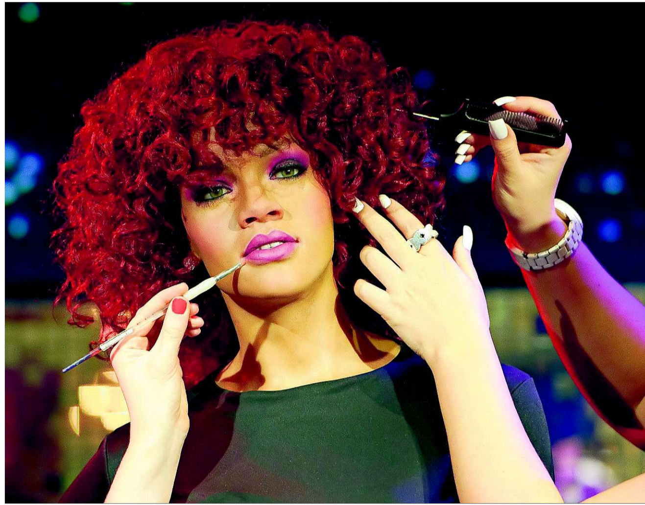
Die Popprinzessin aus Barbados, Rihanna, so echt, wie sie auch echt ziemlich unecht wirkt.